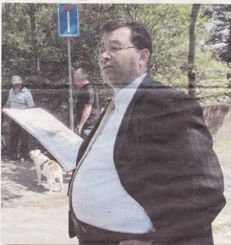
De burgemeester met een stapel affiches.