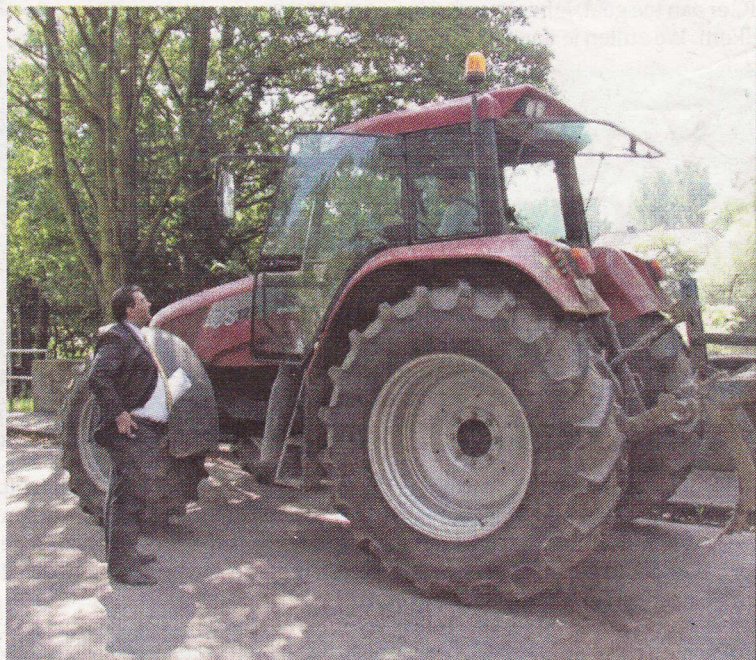
Burgemeester Vlecken in discussie met een tractorbestuurder.